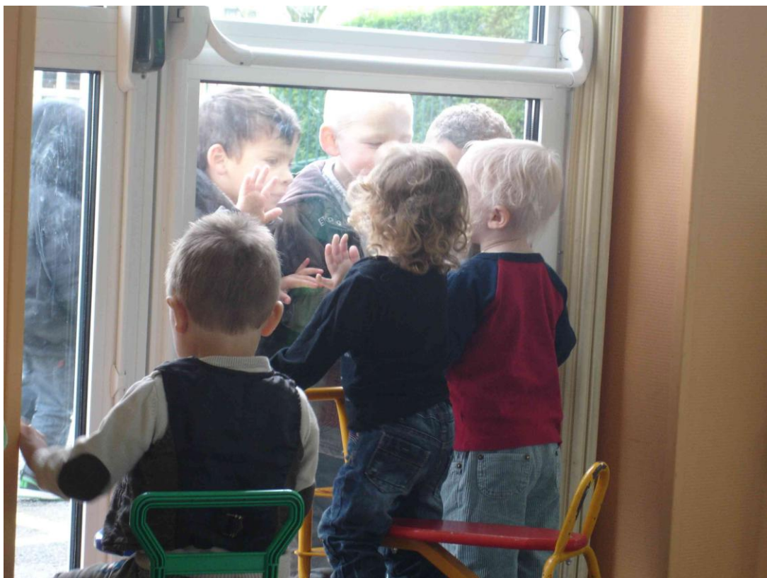
« Premiers échanges avec les élèves de l'école maternelle... »