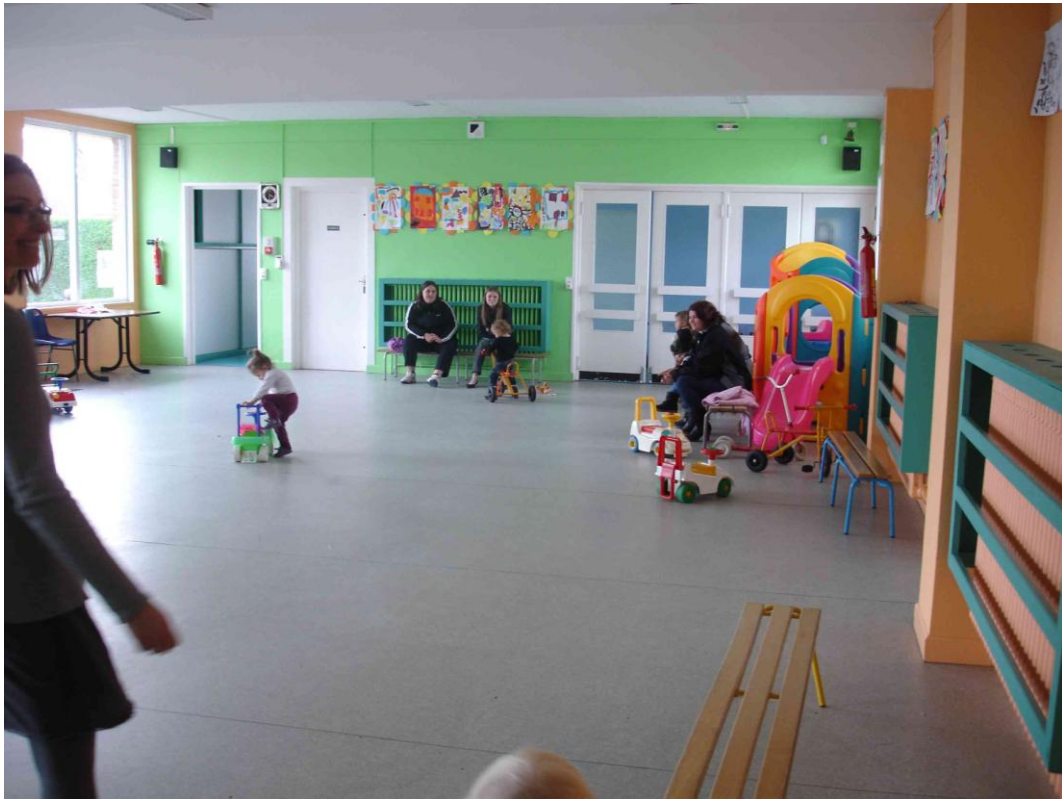
« On retrouve ensuite les mamans »